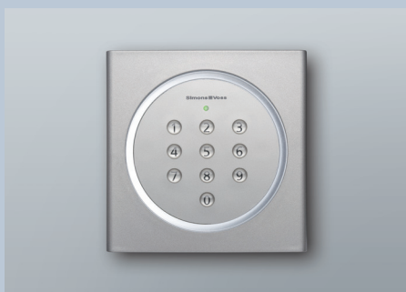
Verkabelungsfreie PinCode-Tastatur 3068

Die batteriebetriebene PinCode-Tastatur wird verkabelungsfrei in das System 3060 integriert und öffnet alle Komponenten per Funk über die Eingabe eines 4- bis 8-stelligen Codes. Die ultraflache Aufputztastatur fügt sich durch den transparenten Ring in jedes Ambiente ein. Die Tastatur wird in Türröhre angebracht und kann im Außen- und Innenbereich sogar auf Glas montiert werden.