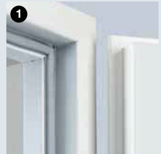
Eckzarge mit umlaufender Dichtung