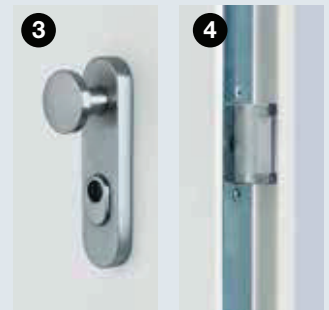
Zieh- und aufbohrgeschützte Sicherheits-Wechselgarnitur