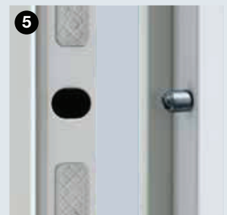
Massive Stahl-Sicherungsbolzen auf der Bandseite